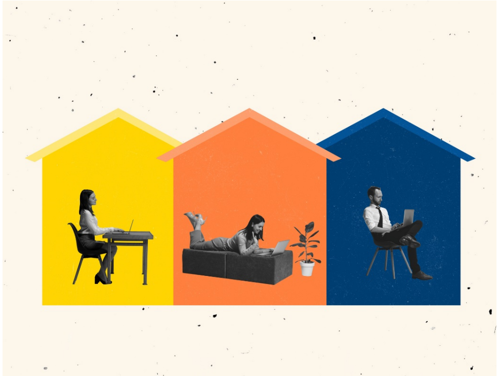
Abbildung 1.3: Vom Unterbau zur agilen Transformation

lassen sich passgenaue Handlungsfelder für Individuen, Teams oder ganze Organisationen ableiten, um – in kleinen Dosen – mehr und mehr Veränderungsfähigkeit herzustellen.